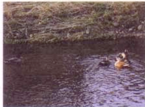
おはよう！いい天気だね