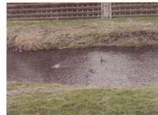
首を伸ばしたカワウ