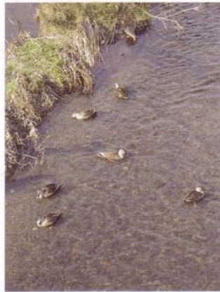
おなじみのカルガモ達