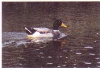
マガモが川を独り占め